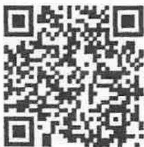
แบบรับฟังความคิดเห็น